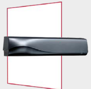
Détection hyperfréquence et sécurité infrarouge actif