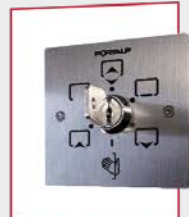
Sélecteur à clés 6 positions 80 mm