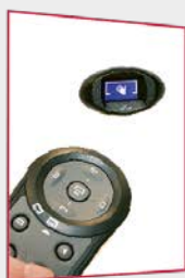
Visioblu et Télécommande S