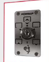
Sélecteur à clés 6 positions 40 mm