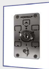
Sélecteur à clés 6 positions 40 mm