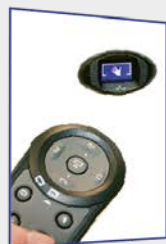
Visioblu et Télécommande S