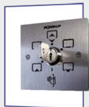
Sélecteur à clés 6 positions 80 mm