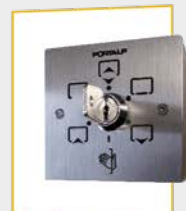
6-standenschakelaar met sleutel 80 mm