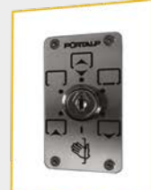
6-standenschakelaar met sleutel 40 mm