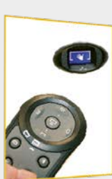
Visioblu en Afstandsbediening S