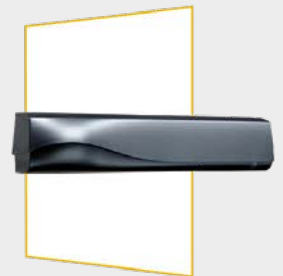
Hyperfrequente radardetector en Actieve IR beveiliging