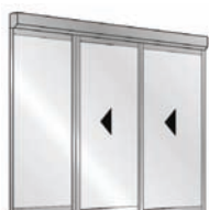
Porte Télescopique 2 vantaux avec Fixe