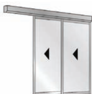
Porte Télescopique 2 vantaux sans Fixe