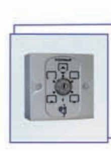
Selector a llave 6 posiciones